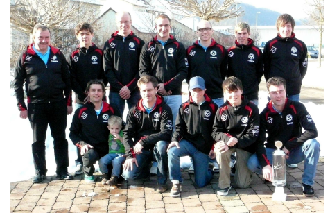
Das Bild zeigt die erfolgreiche Mannschaft der Turner mit Trainer.

Die Bolheimer Kunstturn Männer wurden für Ihre langjährigen Erfolge ausgezeichnet, die 1991 mit dem Aufstieg in die Bezirksliga begann und ihren Höhepunkt 1998 mit der Meisterschaft in der Verbandsliga und den Aufstieg in die Oberliga fand. Nach mehreren Jahren verbleib in der Verbands- und Landesliga stieg man im Jahr 2007 unglücklich in die Bezirksliga ab, konnte aber in diesem Jahr durch eine tolle Mannschaftsleistung den Bezirksligatitel holen und den Wiederaufstieg in die Landesliga feiern. Etliche der Bolheimer Aktiven verfügen über eine Kampfrichterlizenz und unterstützen somit den Turngau bei der Durchführung seiner Veranstaltungen. Zudem werden von den Turnern im eigenen Verein Ämter wie Abteilungsleiter, Pressewart, Übungsleiter und Jugendleiter ausgeführt.