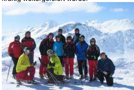
Das Bild zeigt eine Gruppe von Teilnehmern auf Höhe der Galzig - Bergstation bei 2185m.

Wintersport. (ON) Mit einem voll besetzten Bus ging es am 21.03.09 auf nach St. Anton. Während der Anreise konnten sich die Teilnehmer bei einem kleinen Sektfrühstück mit Brezeln stärken und die ersten Sonnenstrahlen des Tages genießen. Im Skigebiet St. Anton angekommen konnte von der Galzigbahn aus ein erster Blick auf den „Mooserwirt“ geworfen werden. In kleineren Gruppen machten sich alle Teilnehmer auf den Weg, das weitläufige Skigebiet rund um St. Anton zu erkunden. Dabei konnten sie die bestens präparierten Pisten bei viel Sonnenschein voll auskosten. Um 15.30 Uhr trafen sich alle Teilnehmer freiwillig beim „Mooserwirt“ und konnten hier mit vielen anderen Wintersportlern ausgiebig „Après-Ski“ feiern. Gegen 18.30 Uhr gab es dann eine Brotzeit vor dem Bus, worauf im Anschluss bei der Heimfahrt im Bus kräftig weitergefeiert wurde.